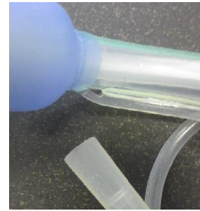
吸引型 吸引チューブ部分