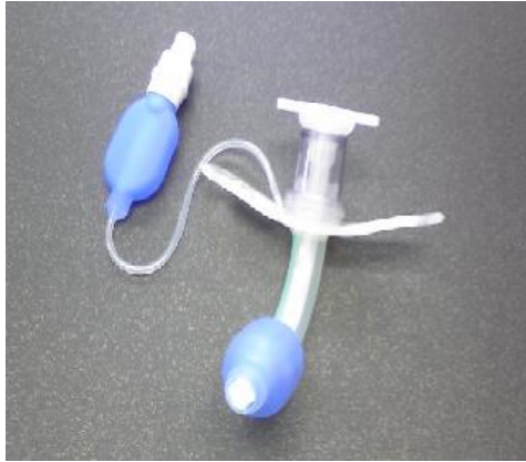
プレフォームド カフ