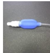
ソフトパイロットバルーン