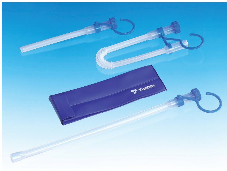
(写真上から 女性用、男性用コンパクトケース、キャリングバッグ、男性用ストレートケース)