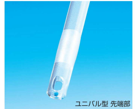
ユニバル型 先端部