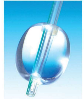
カテーテル先端部

挿入が容易なフラットタイプ。14Fr以上のサイズは、10mLの大容量バルーンを実現。