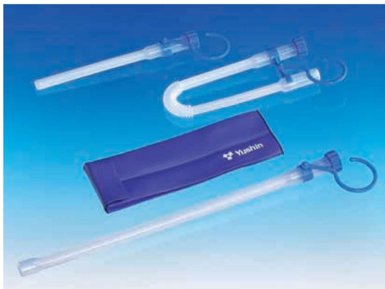
(写真上から 女性用、男性用コンパクトケース、キャリングバッグ、男性用ストレートケース)